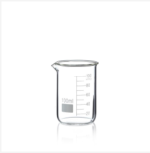
Becherglas - niedrige Form, hitzebeständig, 100 ml