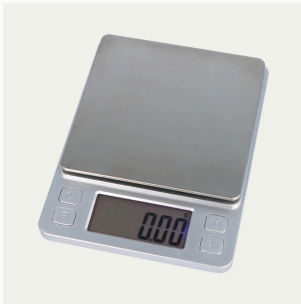
Digitale Feinwaage 0,01 g - 1000 g, 1 St.