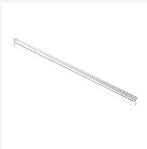
Glasrührstab 20 cm / Durchmesser 7 mm, 1 St.