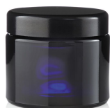
Violettglas Tiegel, 100 ml