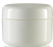
Cremedose doppelwandig weiß, 100 ml